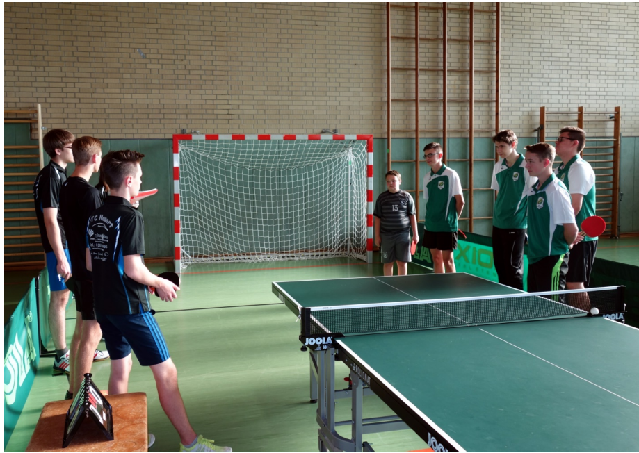
Foto: Die Jugendmannschaften aus Altendiez und Nauort bei der Begrüßung